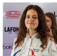
Prix du Commis