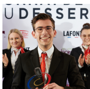
Prix de la salle

Afin de les récompenser, un prix a été remis aux meilleurs d'entre eux.