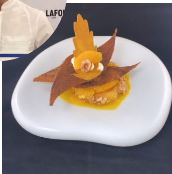
Catégorie Juniors Agathe BONHOMME Lycée hôtelier de Chamalières (63)